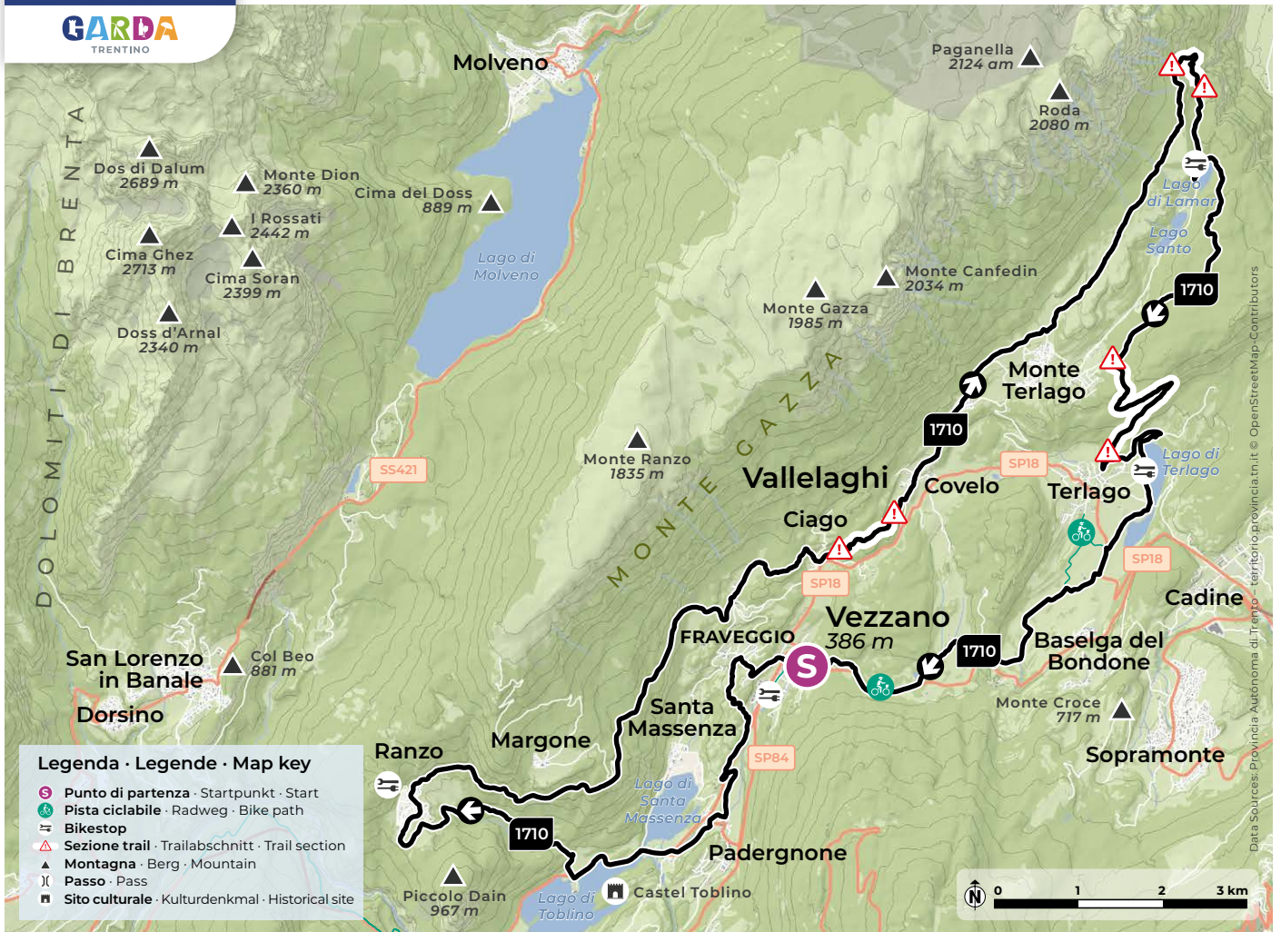
Design and cartography 2024 | max2.at