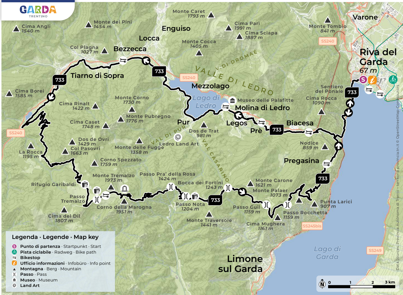
Design and cartography 2024 | max2.at