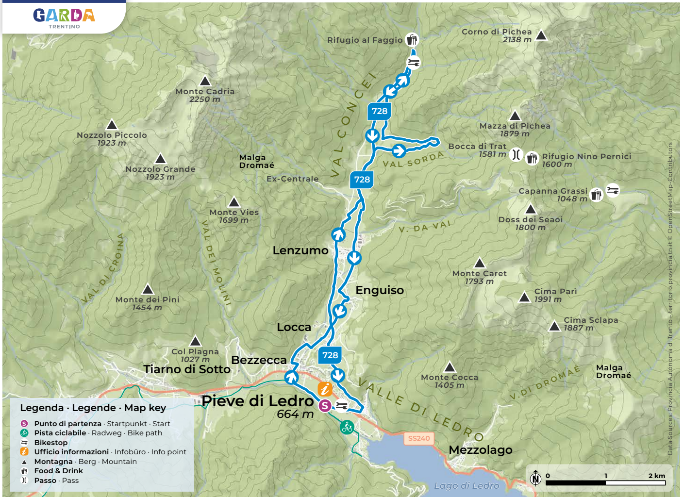
Design and cartography 2024 | max2.at