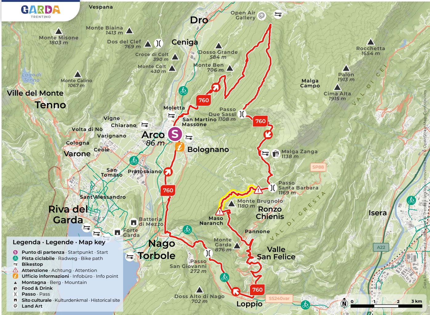
Design and cartography 2023 | max2.at