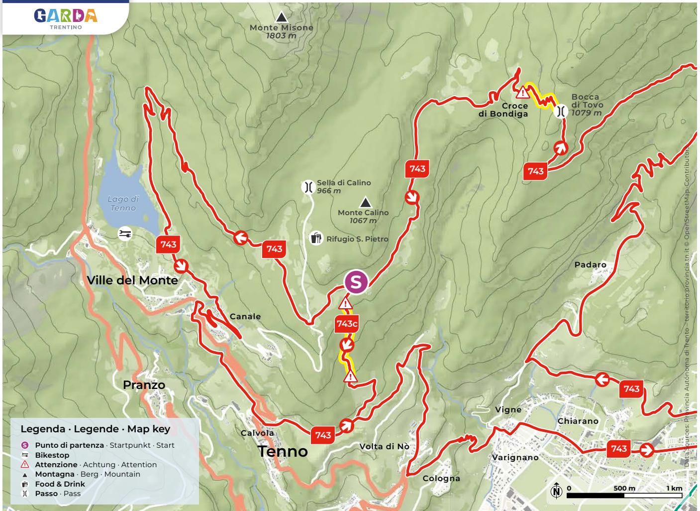
Design and cartography 2023 | max2.at